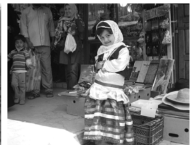
von links nach rechts: die höchste gemauerte Kuppel der Welt in Soltaniyeh, Reisfelder bei Fuman, Mädchen in Masuleh (Provinz Gilan)

Hamadan und Kordestan: Auch die Region südlich der aserbaidtschanischen Provinzen Irans hat kulturell und landschaftlich dem Reisenden einiges zu bieten. Durch den Nordteil des Zagros-Gebirges führt unsere Route über Hamadan und durch den östlichen Teil von Kordestan. Nicht nur erdgeschichtlich (z.B. Höhle von Ali Sadre), sondern auch kulturell führt die Route weit in die Vergangenheit. Hamadan (griech. Ekbatana ), vor 2700 Jahren Hauptstadt der Meder, war lange Zeit eine der wichtigsten Städte Irans. Über das kurdische Bergland erreichen wir Takt-e Soleyman, einen Feuertempel der Sasaniden aus dem 5.-6. Jh.