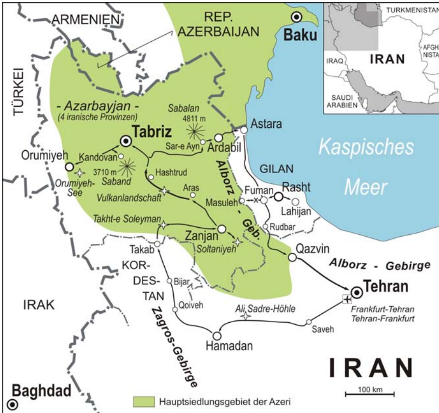
Reiseziele und -route im Überblick