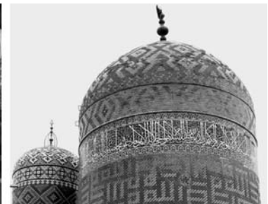
von links nach rechts: Salzkristalle am Ufer des Orumiye-See, im Bazar von Tabriz, Mausoleum von Sheikh Safi in Ardabil