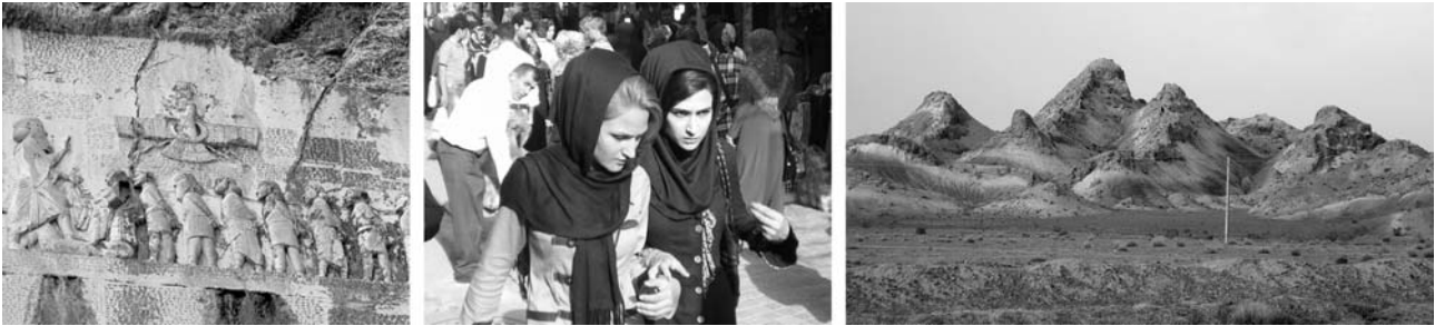
von links nach rechts: Relief von Bisotum, turkstämmige Azeri, Vulkanlandschaft im Hochland von Azarbaijan

(Übernachtungen: je 1 x in Tehran, Hamadan, Takab und Zanjan – Hotels s.u.)