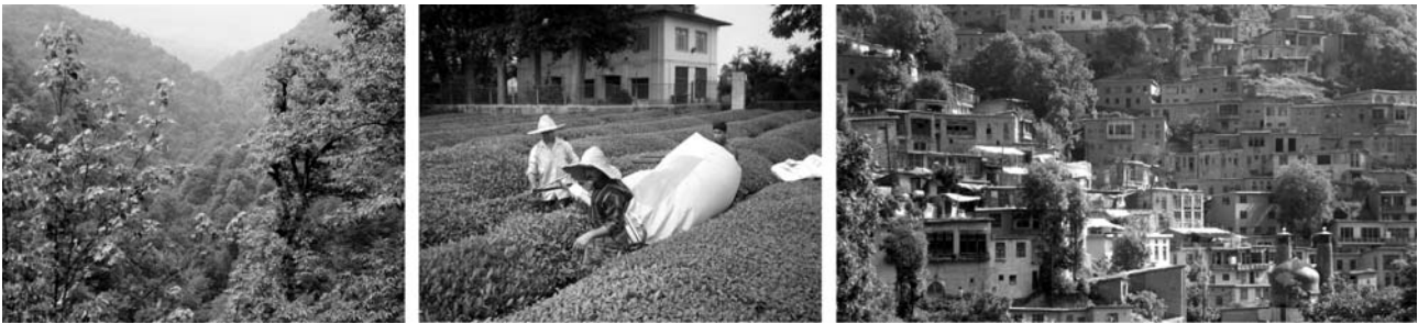
von links nach rechts: Kaspischer Bergwald, Tee-Plantage bei Fuman, Masuleh an den Hängen des Alborz-Gebirges

(Übernachtungen: 2 x bei Fuman, 1 x in Tehran – Hotels s.u.)